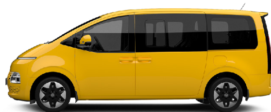
Dynamic Yellow nur für Kastenwagen verfügbar