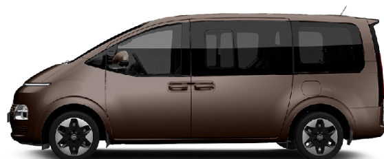
Galaxy Maroon Pearl nur für Prestige Line