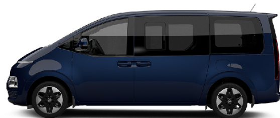
Classy Blue Pearl