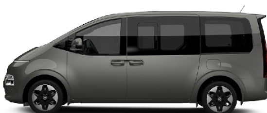
Cast Iron Brown Pearl nur für Prestige Line