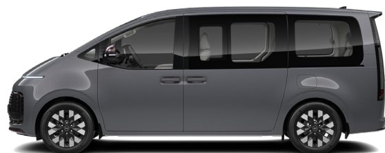
Ecotronic Gray Pearl