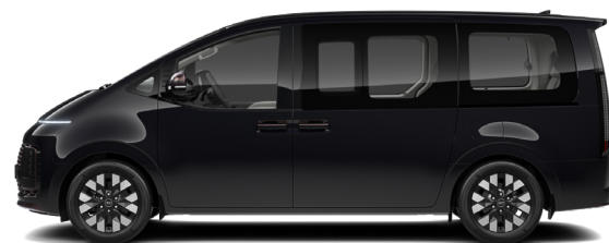
Abyss Black Pearl