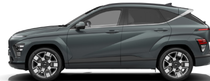
Cypress Green Pearl