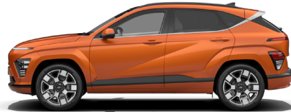
Jupiter Orange Metallic