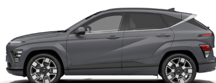
Ecotronic Gray Pearl