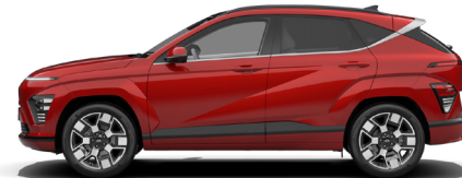
Ultimate Red Metallic