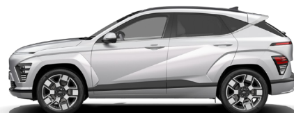
Shimmering Silver Metallic