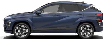
Sailing Blue Pearl