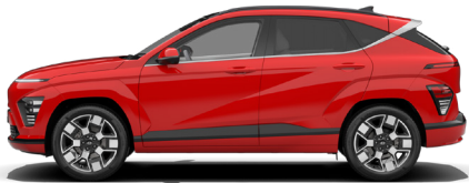
Engine Red Solid