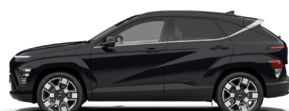
Abyss Black Pearl