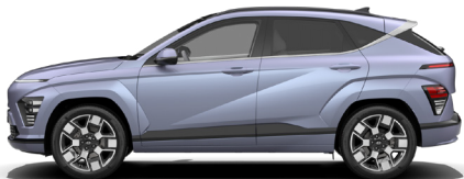
Meta Blue Pearl