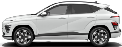
Serenity White Pearl