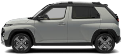
Aero Silver Matte Kontrastdach verfügbar