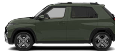
Tomboy Khaki Kontrastdach verfügbar nicht für Cross Line