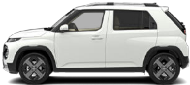
Atlas White Kontrastdach verfügbar