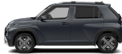
Dusk Blue Matte nicht für Cross Line

Pflegehinweis bei Fahrzeugen mit Mattlackierung: Autowaschanlagen mit drehenden Bürsten dürfen nicht verwendet werden, da sie die Oberfläche Ihres Fahrzeugs beschädigen können. Dampfreiniger, die die Fahrzeugoberfläche mit hohen Temperaturen reinigen, können dazu führen, dass Öl auf dem Lack haftet und schwer zu entfernende Flecken bildet. Verwenden Sie bei der Autowäsche ein weiches Tuch (z. B. Mikrofaser Tuch oder Schwamm) und trocknen Sie das Auto mit einem Mikrofaser Tuch. Wenn Sie Ihr Auto von Hand waschen, sollten Sie keinen Reiniger verwenden, der mit einer Wachsbehandlung abschließt. Wenn die Fahrzeugoberfläche stark verschmutzt ist (Sand, Schmutz, Staub, Verunreinigungen usw.), spülen Sie die Oberfläche zunächst mit Wasser, bevor Sie das Fahrzeug waschen. Verwenden Sie keinen Lackschutz (wie Schaumwaschmittel), Scheuermittel oder Politur. Wurde Wachs aufgetragen, entfernen Sie das Wachs umgehend mit einem Silikonreiniger. Wenn Teer oder Teerverunreinigungen vorliegen, verwenden Sie zu deren Entfernung einen geeigneten Teerentferner. Achten Sie jedoch darauf, nicht zu viel Druck auf die Lackierung auszuüben.