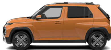
Sienna Orange Metallic Kontrastdach verfügbar nicht für Cross Line