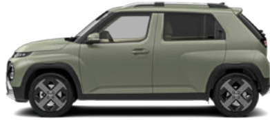
Bijarim Khaki Matte nicht für Cross Line