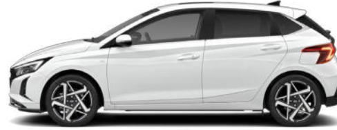
Atlas White Kontrastdach verfügbar