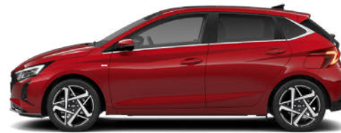
Dragon Red Pearl Kontrastdach verfügbar