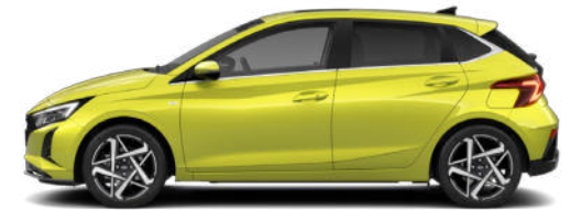
Lucid Lime Metallic Kontrastdach verfügbar