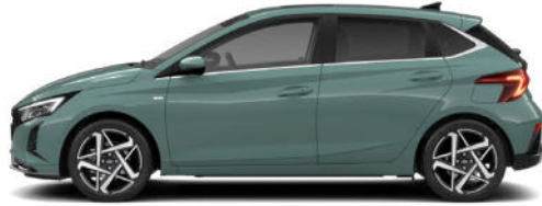
Mangrove Green Pearl Kontrastdach verfügbar