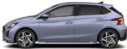
Meta Blue Pearl Kontrastdach verfügbar