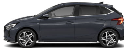
Aurora Gray Pearl