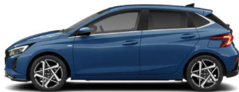
Vibrant Blue Pearl Kontrastdach verfügbar