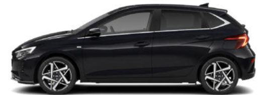
Phantom Black Pearl