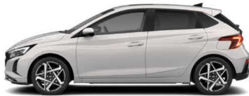
Lumen Gray Pearl Kontrastdach verfügbar